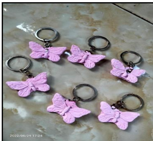
Gambar 1.2 Hasil Karya Anak Pada Siklus 2

Berdasarkan hasil penelitian yang dimulai dari kegiatan penelitian pra siklus, dilanjutkan dengan siklus I dan siklus II dalam meningkatkan kemampuan motorik halus