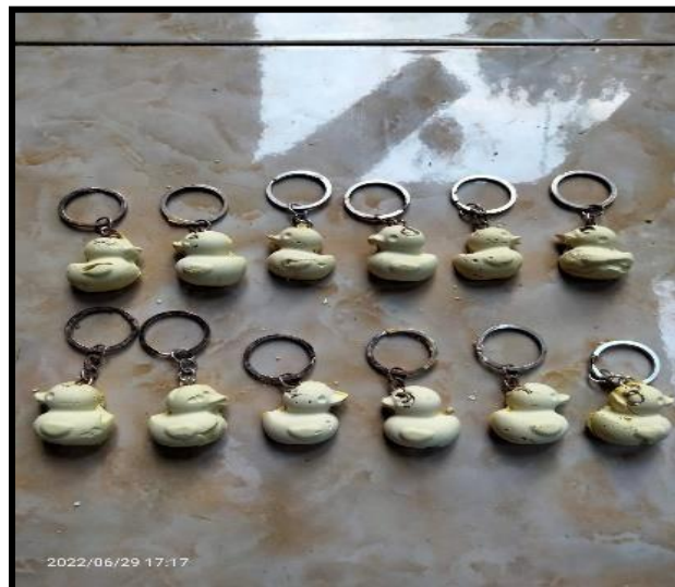
Gambar 1.1 Hasil Karya Anak pada Siklus I

memaksimalkan koordinasi mata dan tangannya. Kecapaian perkembangan motorik halus sangat digunakan dalam kegiatan ini dimana ketercapaian tiga indikator yang dijelaskan yaitu menggerakkan jari jemari, mengkoordinasikan gerak mata dan tangan, lalu ketrampilan kedua gerakan tangan harus dapat tercapai dengan kegiatan ini dan hasilnya anak dapat berkembang mencapai presntase dari 13 anak terdapat 10 anak yang mencapai 76,92% dalam melaksanakan kegiatan, ini dapat meningkat dengan perlakuan pada siklus II. Berikut adalah gambar hasil karya anak: